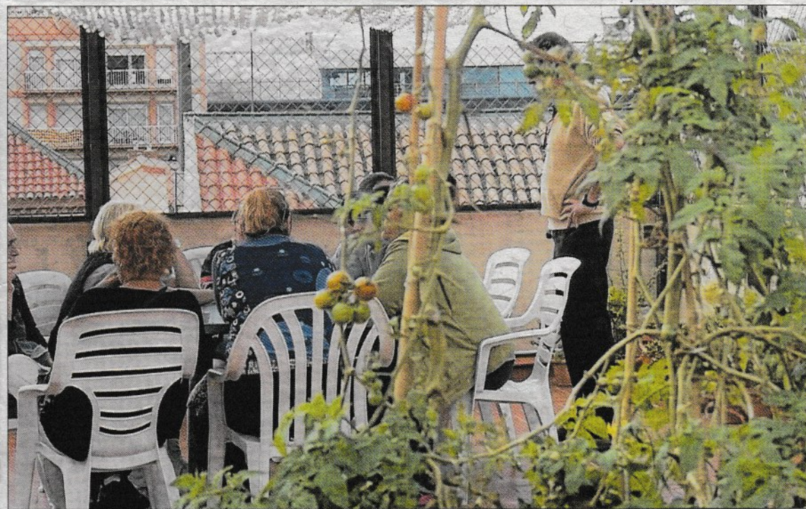
La comunidad terapéutica lleva diez años atendiendo a mujeres con problemas de adicción.